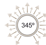
Ángulo de iluminación de 345° 345° illumination angle