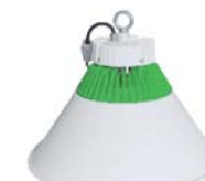
Campana LED / LED high bay (Página/Pages 96). PHC1206NR - PHC1456NR - PHC2006NR