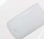
Pantalla Neophos / Neophos Fittings (Página/Pages 70). LPL0620NR - LPL1240NR