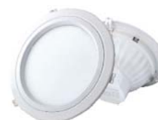
Downlight LED 25W | 25W LED Downlight (Página/Pages 126). PWD253NR - PWD254NR