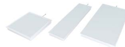
Panel LED/LED panel 600x600-1200x300-1200x600 (Páginas/Pages 50, 52, 54, 56, 58). P6P40X4 - P6P40X6 - Superficie / Continuo P3P40X4 - P3P40X6 - Superficie / Continuo P12P7X4 - P12P7X6 - Superficie / Continuo