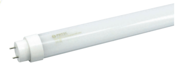
PU06CNSF - PUI2CNSF - PUI5CNSF