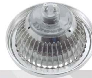
PQ623GUN - PQ624GUN PQ623GUR - PQ624GUR

The exceptional design of the 111-LED G5 model, allows you to replace your old QR111 lamp without worrying about the cardan type where it needs to be installed. Many kinds of brackets are available in the market and this model fits them all. Back, front or by connexions, you can now forget about incompatibilities.