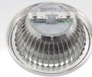
PQ623G5N - PQ624G5N